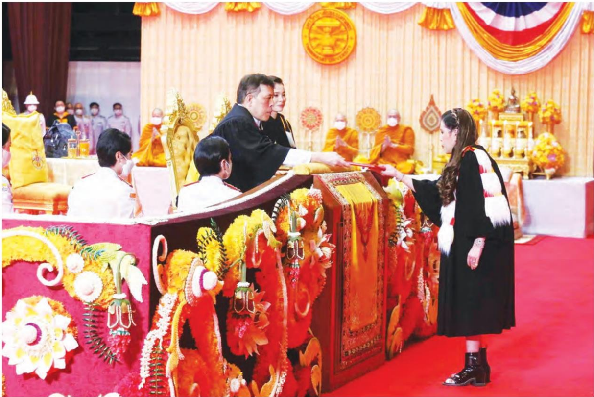
พระบาทสมเด็จพระเจ้าอยู่หัว และสมเด็จพระนางเจ้าฯ พระบรมราชินี เสด็จพระราชดำเนินไปทรงเปิดอาคาร กิตติยาคาร และพระราชทานปริญญาบัตรแก่ผู้สำเร็จการศึกษาจากมหาวิทยาลัยธรรมศาสตร์ ประจำปีการศึกษา 2564 ณ มหาวิทยาลัยธรรมศาสตร์ ศูนย์รังสิต อ.คลองหลวง จ.ปทุมธานี ในการนี้ สมเด็จพระเจ้าน้องนางเธอ เจ้าฟ้าจุฬาภรณวลัยลักษณ์ อัครราชกุมารี กรมพระศรีสวางควัฒน วรขัตติยราชนารี เข้ารับพระราชทานปริญญาปรัชญาดุษฎีบัณฑิตกิตติมศักดิ์ สาขาวิชาเคมี

หัวข้อข่าว: พระบาทสมเด็จพระเจ้าอยู่หัว และสมเด็จพระนางเจ้าฯ พระบรมราชินี